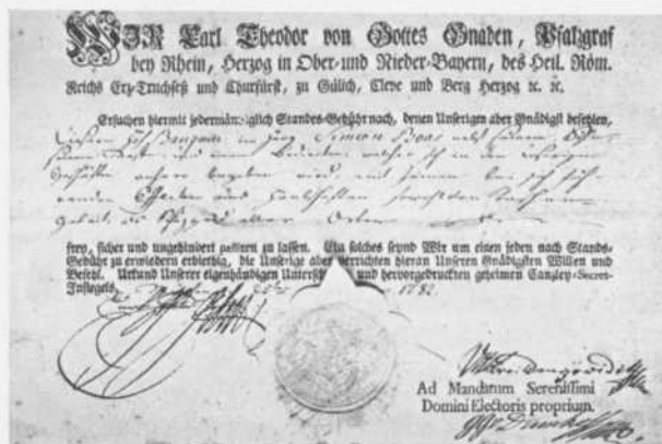
Paspoort van Simeon Boas, Hofbankier, zijn zoon, zijn neef en bediende 1782.

De allergrootste meerderheid verklaarde zich accoord met de surcéance van betaling en het daarna aangeboden accoord. Dat geeft geen verwondering, want de activa hadden een waarde van 1.103.566 gld. 3 st. waartegenover schulden stonden tot een bedrag van 31.181.12 st. 12 p.